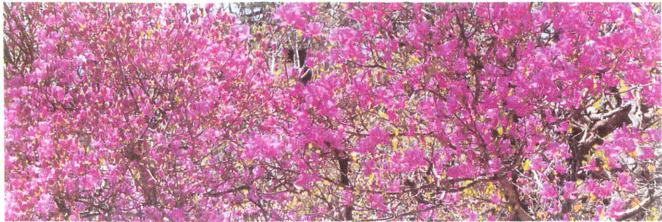
コバノミツバツツジ (小葉の三つ葉躑躅)