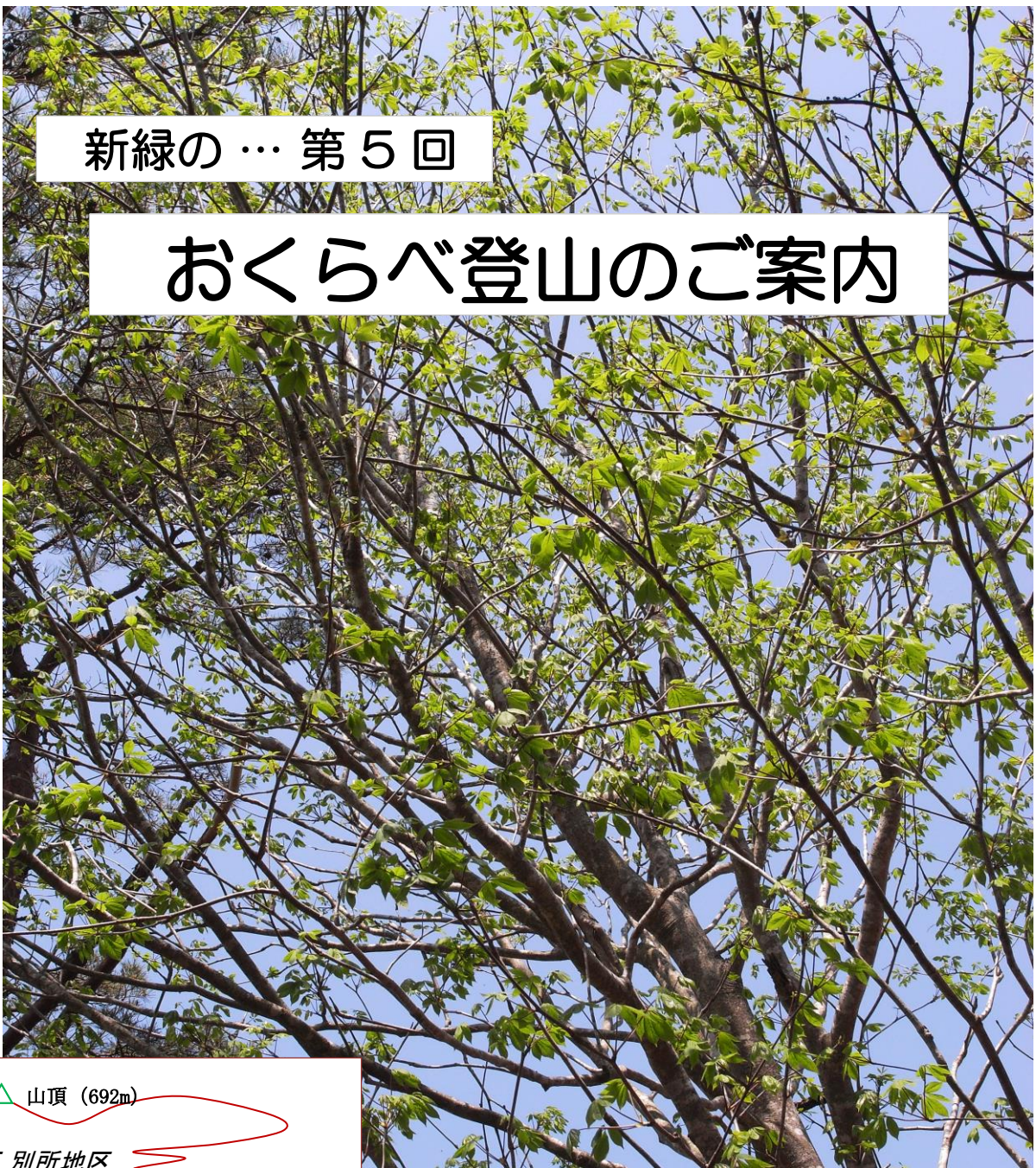
山頂付近のコシアブラ